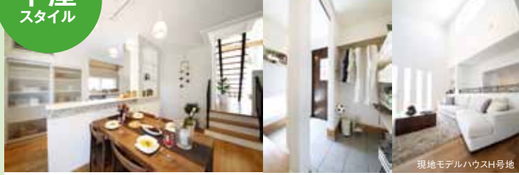
現地モデルハウスH号地

都市部でもワンフロアの快適な暮らしをお望みの方は新発想の広々「平屋スタイル」がオススメ。